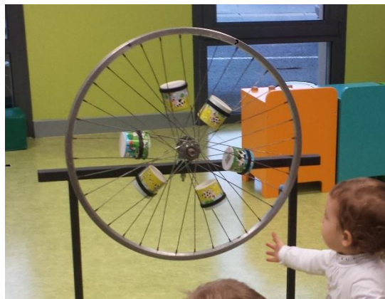
la roue à Meuh