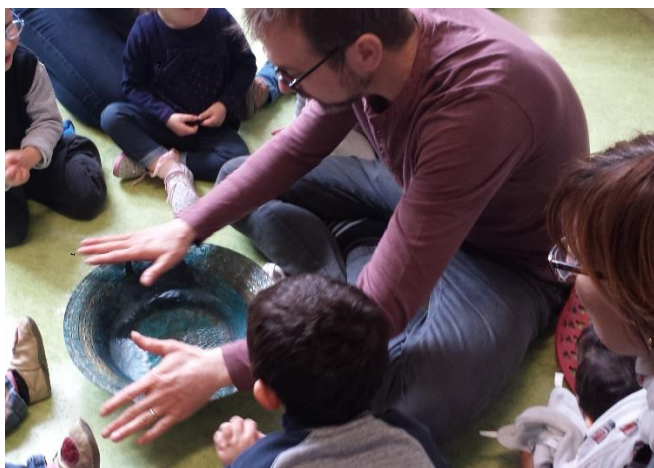
Le bol taoiste