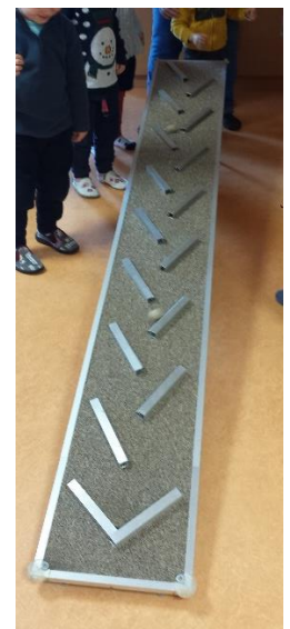
le toboggan musical