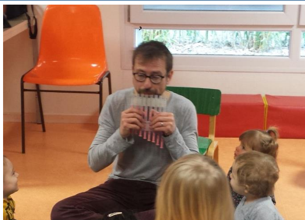
La doli-flute de Pan