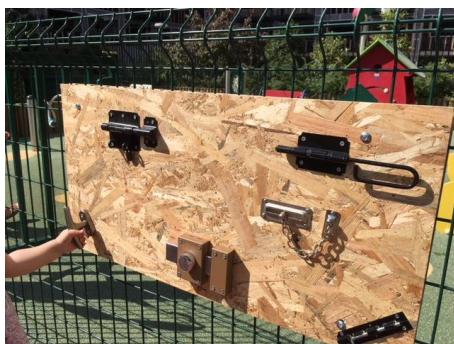
Tableau de serrures