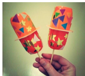
les maracas-petits suisses