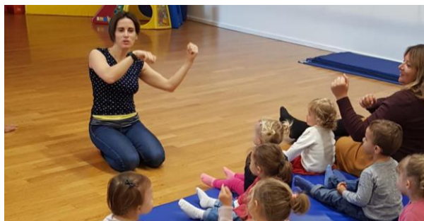
Les enfants adorent reproduire les gestes associés aux comptines.

En plus d'aider un enfant à développer son langage, apprendre une chanson ou une comptine stimule son attention et sa concentration. Cet apprentissage est aussi un bon exercice de mémoire en soi. Quand elles s'accompagnent de gestes, les chansons et les comptines contribuent également au développement moteur et à la motricité fine du tout-petit.