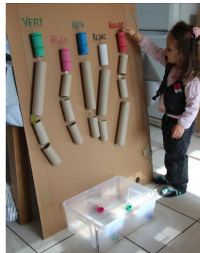
toboggan à pompons