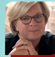
Catherine Vautrin, présidente de Reims Métropole

« Unis et rassemblés, nous pèserons davantage dans les grands dossiers au sein de la nouvelle région. »